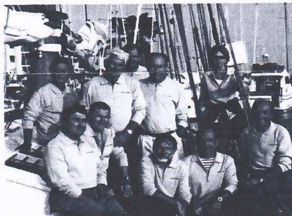
L'équipage au Pouliguen