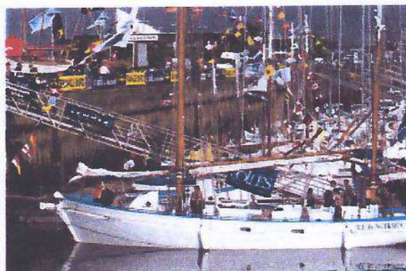
Le Matroger au ponton du Village Bois

Après avoir délesté le bateau de 1 tonne de plomb et bricolé quelques aménagements intérieurs, nous avons fait route vers La Rochelle, avec une escale aux Sables d'Olonne. Emplacement très en vue dans le « village bois » (vieux gréements) du Grand Pavois. Beaucoup de monde en visite à bord.