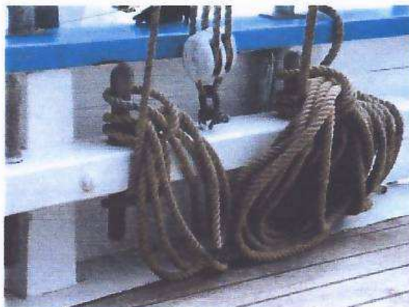
Le charme d'un vieux gréement