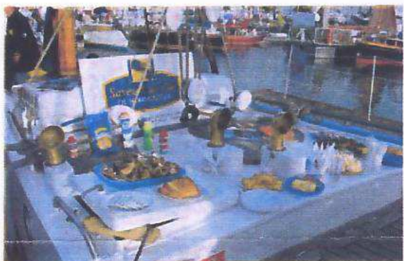
Les saveurs de l'île sur le pont du Martroger