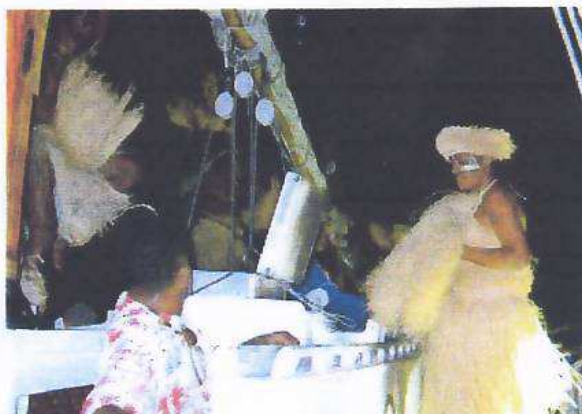
Danseuse canaque à bord du Martroger

Sous un ciel embrasé par un extraordinaire feu d'artifice (1 heure!), le bateau « Ile de Noirmoutier », puisque c'est comme cela que les charentais le nomment dorénavant, a exécuté sur l'eau une prestation remarquable et remarquée avec à la barre Jean-Luc, maître du genre.