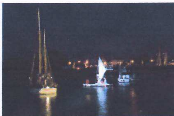
La pirogue canaque s'approche du Martroger

Rôle « phare » pour le Martroger, en tête de la flotte près des tours de La Rochelle, devant des dizaines de milliers de spectateurs rassemblés sur les quais. Des danseurs et danseuses canaques ont évolué sur le pont du Martroger sous le feu des projecteurs embarqués à bord.