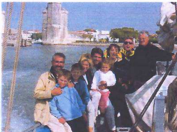
Nos sympathiques passagers de Mercedes

A la demande des organisateurs du Grand Pavois, sortie en mer autour de l'île d'Aix et de Fort Boyard pour les sponsors de la manifestation, la direction de MERCEDES. Contacts importants entre ce grand constructeur automobile et les responsables d'associations noirmoutrines.