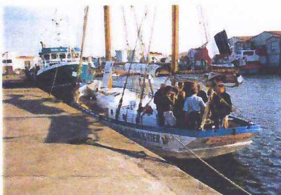
Le Martroger dans le bassin de Port-Joinville