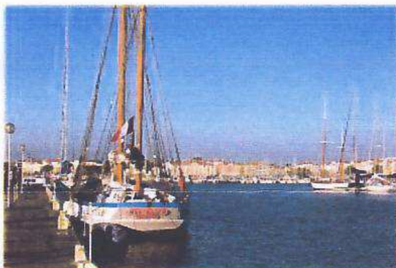
Le Martroger en escale aux Sables d'Olonne

Retour sur Noirmoutier avec une nouvelle escale aux Sables d'Olonne, des souvenirs plein la tête.