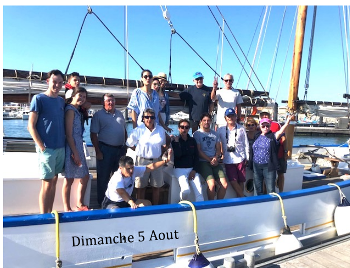
Dimanche 5 Aout

Chaque année c'est un grand plaisir de participer aux VOILES DE TRADITION à PORNIC.