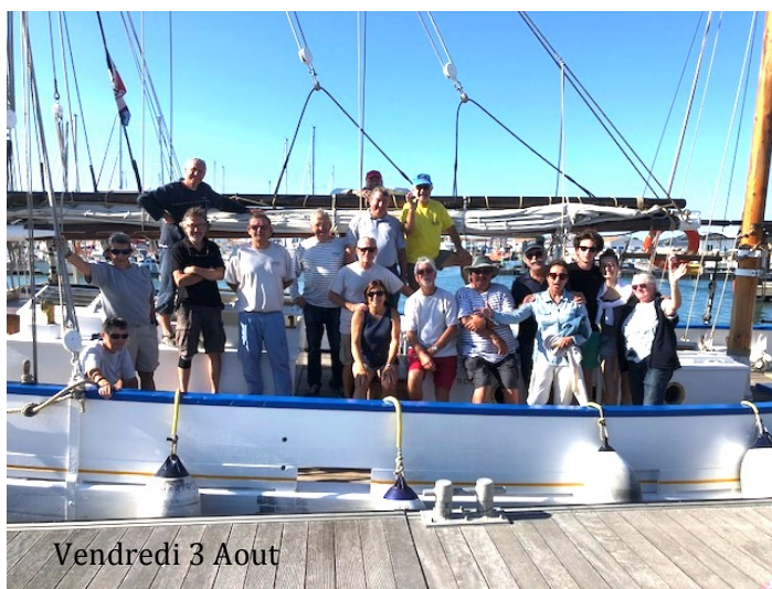
Vendredi 3 Aout