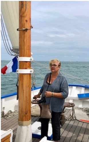
Catherine à la barre