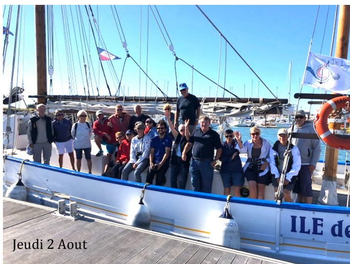
Jeudi 2 Aout

Le mot du Président : À peine rentré de Douarnenez, le MARTROGER continue son intense activité avec 4 belles sorties pour accompagner la NO CLASSIC sur le plan d'eau de la baie de Bourgneuf. En compagnie de 3 bateaux mythiques : PEN DUICK II, PEN DUICK III et PEN DUICK V. Ces sorties sont l'occasion de faire participer le plus grand nombre d'adhérents.