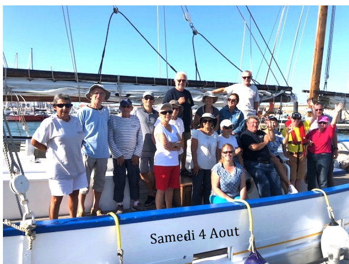
Samedi 4 Aout