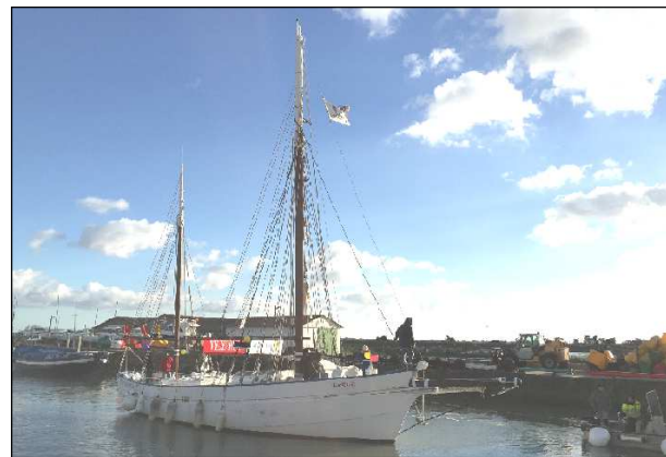
Le Martroger aux couleurs du Téléthon

Départ de l' Hermione pour les Etats-Unis 18 avril 2015