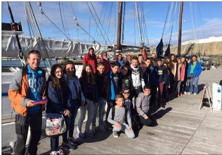
A leur tour 24 jeunes du collège Pays de Monts découvrent le bateau.