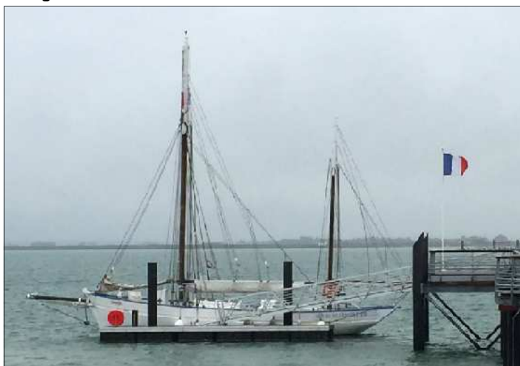
Sous une pluie battante, 14 courageux ont conduit le Martroger à l'inauguration de la nouvelle estacade de Barbâtre