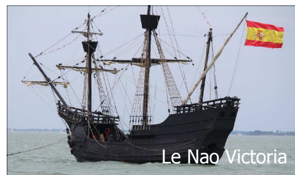
Le Nao Victoria