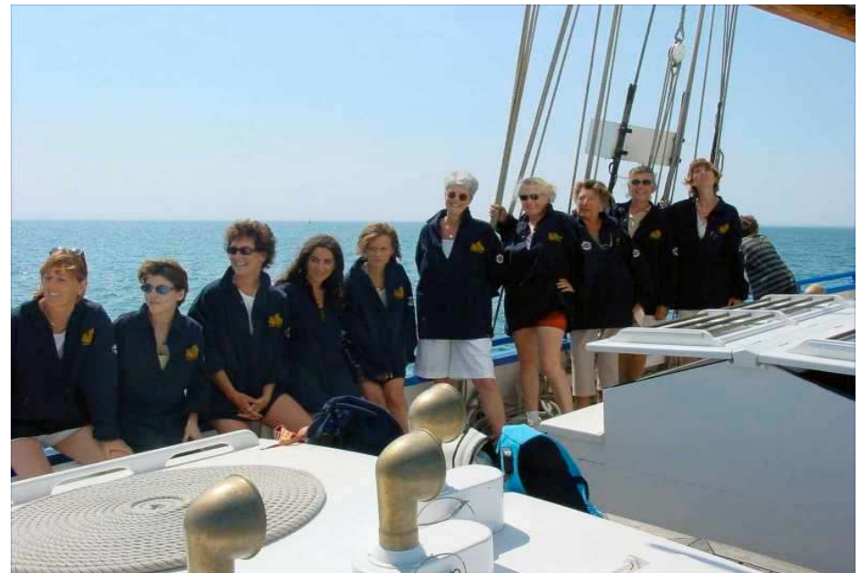
mais pas toujours.