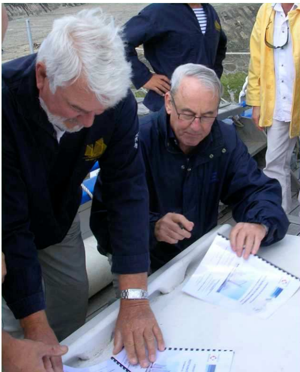
Signature de la convention avec la Fondation du Patrimoine