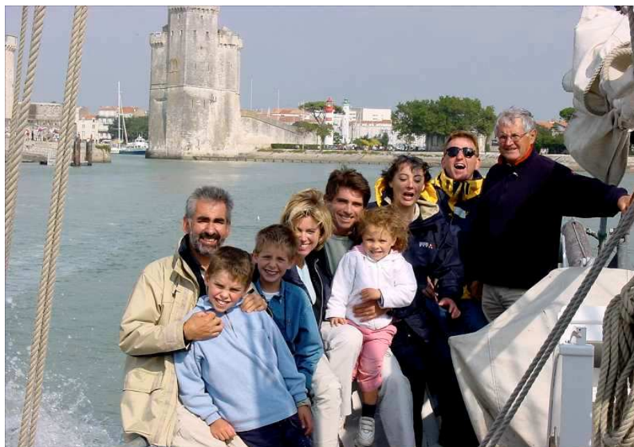
avec les invités d'une prestigieuse entreprise d'automobiles.