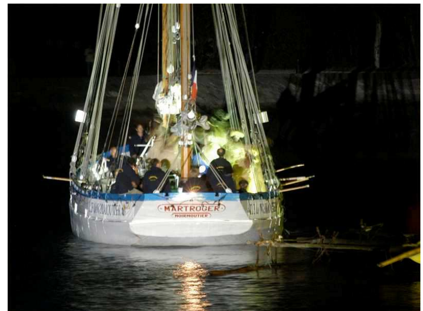
Les danseurs néo-calédoniens à bord du Martroger III

En 2003, il a accueilli à son bord les danseurs de Nouvelle Calédonie et a été retenu pour l'affiche du spectacle de l'année 2004.