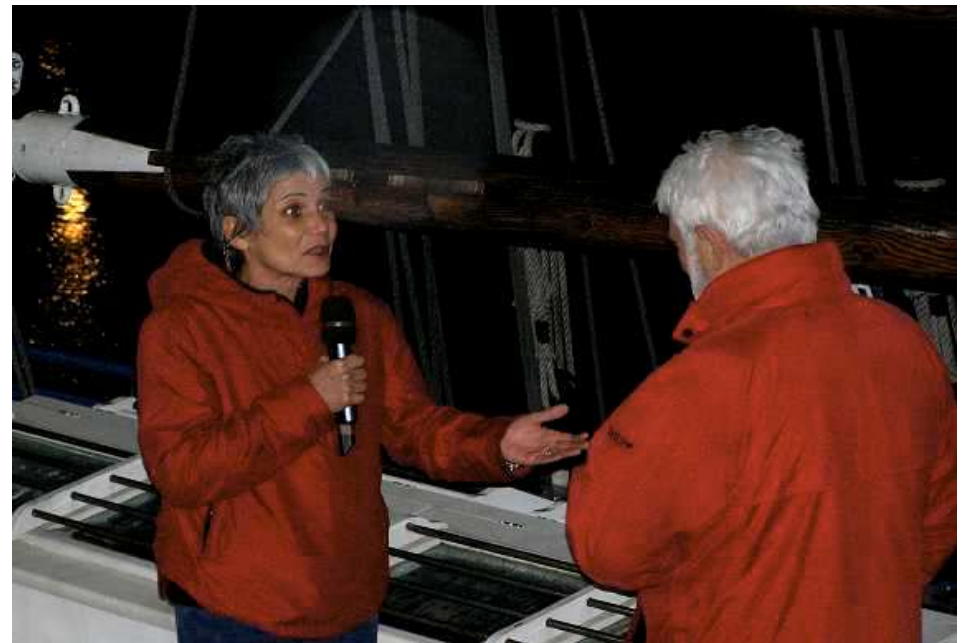
Interview à bord, lors de l'émission « Thalassa » de France 3