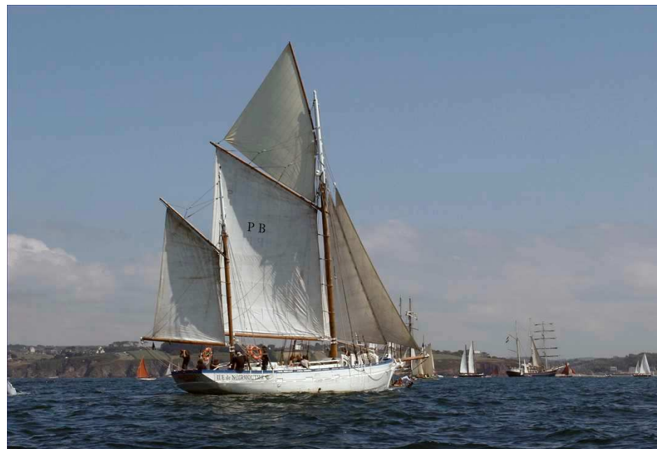
Martroger III à Brest 2004

Il s'est aussi rendu dans de nombreux ports de notre région dans le cadre de visites de courtoisie.