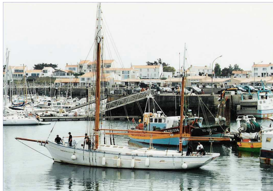
Martroger III a retrouvé son aspect d'origine

C'est ainsi que nous avons participé à de prestigieuses manifestations, le Grand Pavois de La Rochelle, la semaine du Golf du Morbihan, la LANCEL Classic, Brest 2004 et bien d'autres.