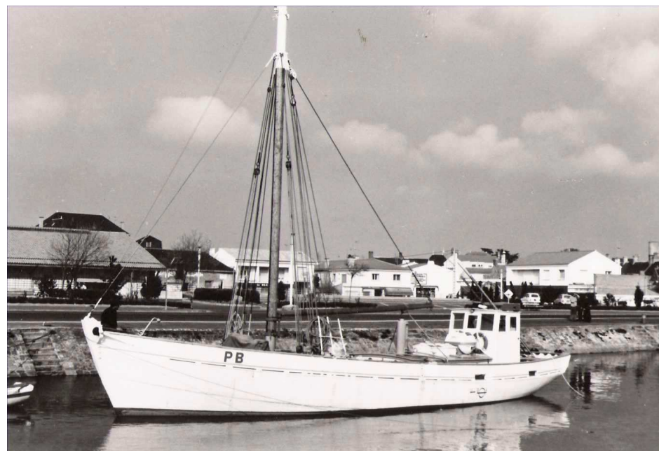
et peu avant sa réforme.