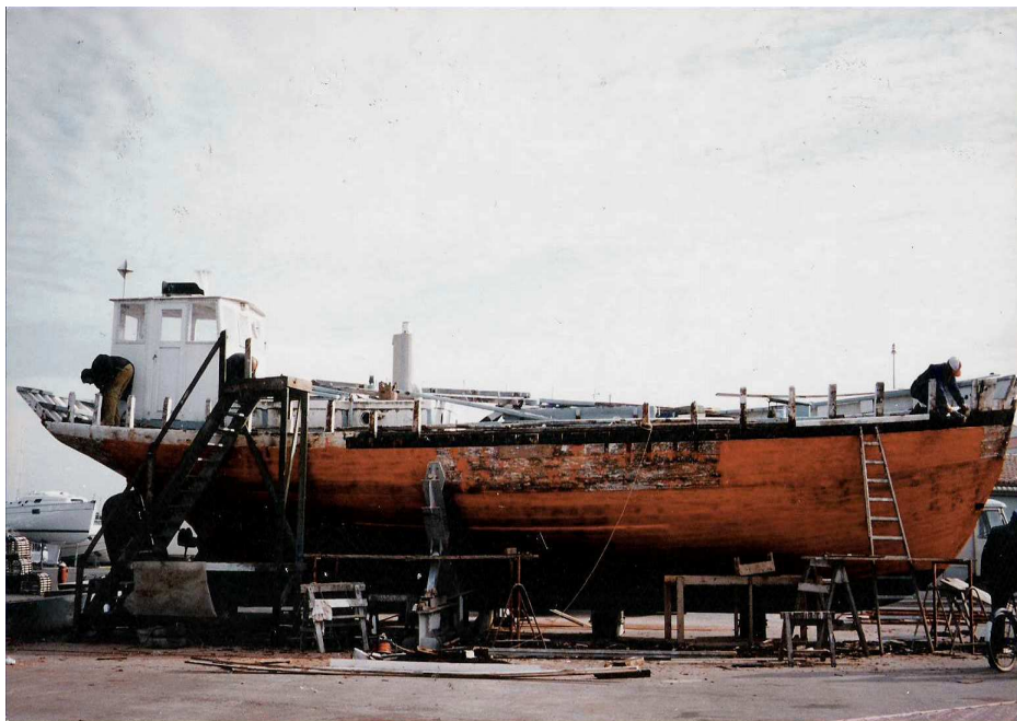
La restauration commence