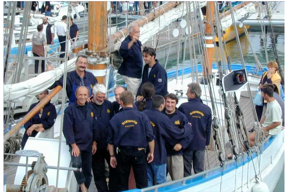
L'équipage est majoritairement masculin....

- Sauvegarder ce patrimoine maritime régional et national, classé monument historique, et durement menacé. Le navire sera restauré sur le port de Noirmoutier, sous chapiteau.