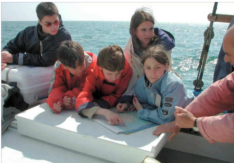
Jeunes noirmoutrins en stage de découverte

- Assurer les visites guidées autour du chantier auprès des visiteurs comme des scolaires et faire découvrir ainsi ces savoir-faire traditionnels tels que la charpente navale et, pourquoi pas, susciter des vocations.