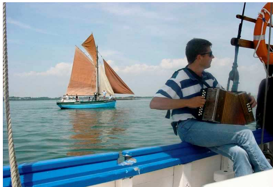
Semaine du Golfe 2003: Aux côtés du « Hope » de Saint Gilles Croix de Vie