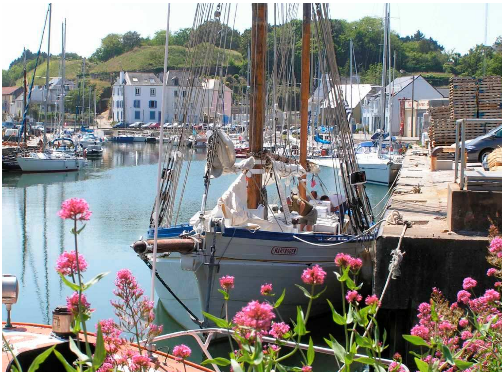
Le Martroger III à Belle-Île