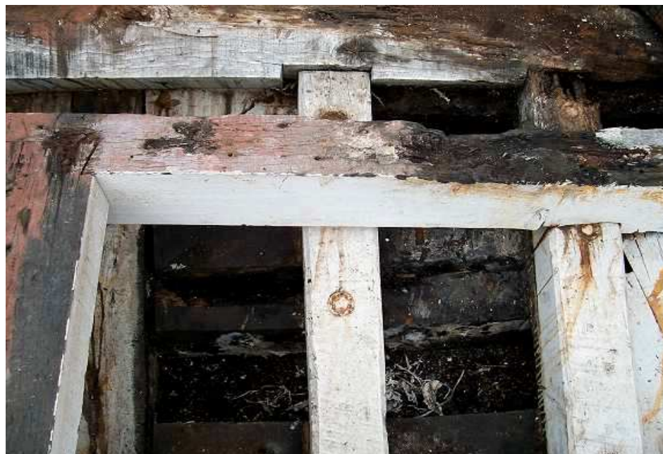
Pièce de bois attaquée par la méréule