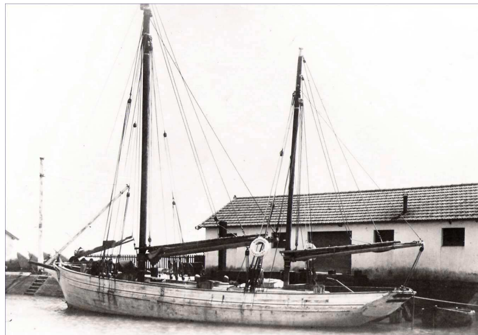
Le Martroger III dans son état d'origine...

Classé monument historique en 1993 et une fois ma restauration terminée, mon propriétaire a confié ma mise en œuvre à une association : "les Amis du Martroger". Nous avons fait de belles choses ensemble en naviguant tout autour de Noirmoutier, de La Rochelle à Brest.