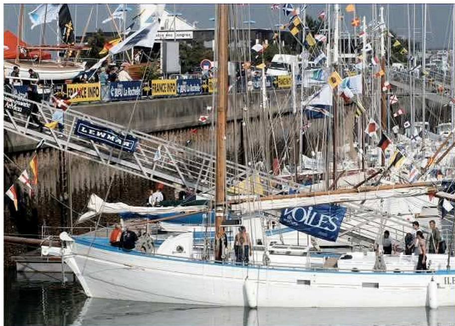
Au Grand Pavois de La Rochelle....