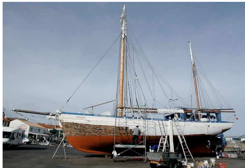
Décapage de la coque avant expertise

Ces fonds publics devraient couvrir 60 à 70% du montant de cette restauration, le complément devant provenir de partenaires privés.