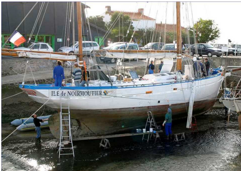
Les « Amis du Martroger » au travail