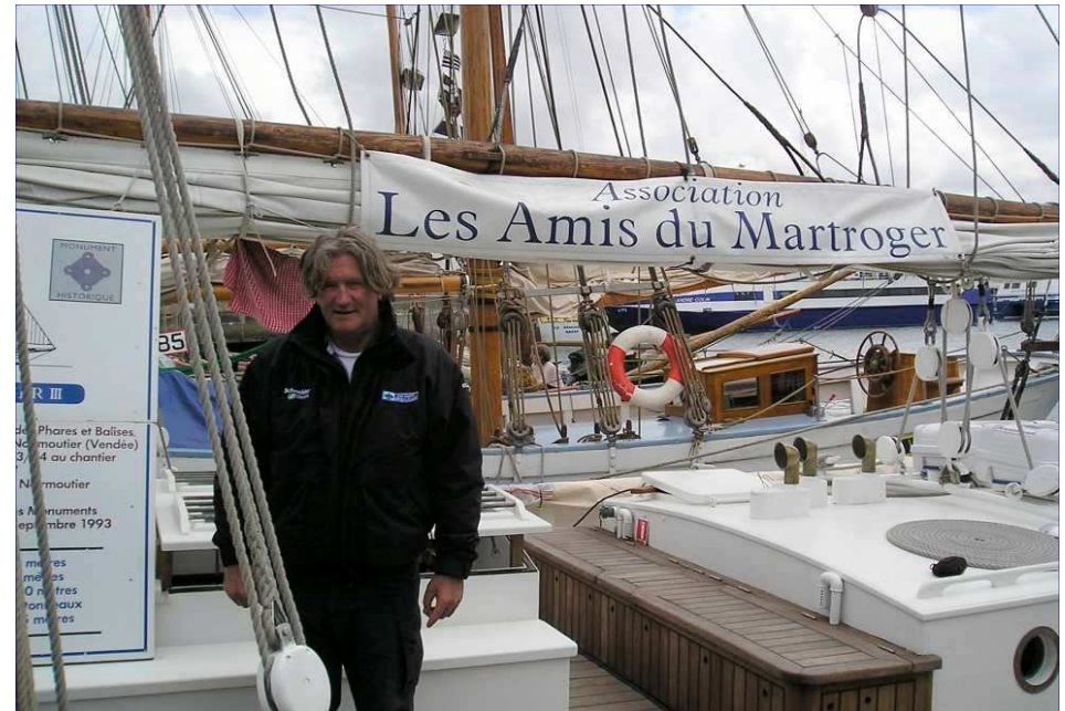
Un visiteur de marque à Brest 2004

Le Martroger III est le dernier baliseur à voiles de France, en associant votre entreprise à sa restauration, vous apporterez une contribution significative à la sauvegarde de notre patrimoine maritime.