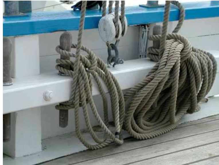
Textes: Bernard Chrétien, Alain Maroncle BCh octobre 2007