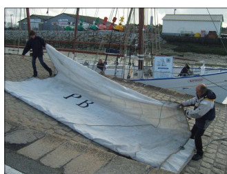
Hivernage des voiles