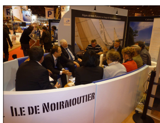
Stand du Salon Nautique

Début décembre, l'association était présente au Salon Nautique de Paris, sur le stand de Noirmoutier. Cela a été l'occasion de passer en boucle, sur écran télé, le film réalisé par Canal+ en septembre sous la direction de Jean Galfione. Nous serons en mesure de vous le présenter à l'Assemblée Générale.