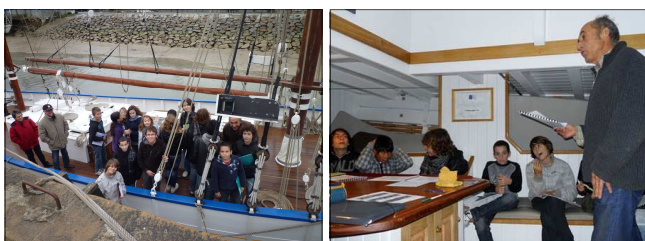
Accueil à bord des élèves de 4 ème du Collège Molière